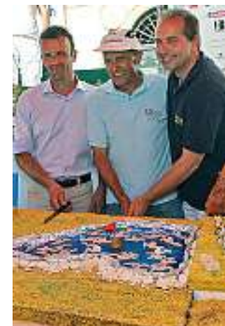
Mega torta per il trentennale

ponti, sarà un momento assolutamente imperdibile.