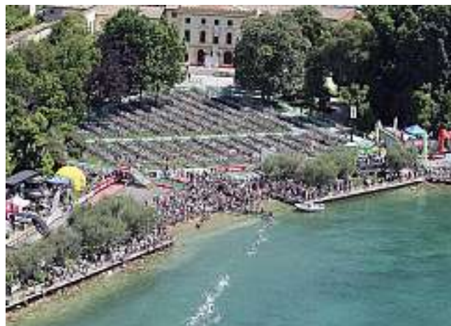
La folta schiera dei concorrenti pronta alla partenza

Quest'anno alcune novità renderanno ancora più spettacolari i 2 giri finali affrontati dagli atleti: il passaggio sopra la zona di arrivo, grazie ad un sistema di